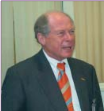
Oud-min. en comm. der Koningin Jhr. dr. P.A.C. Beelaerts van Blokland, procureur van Juncta Juvant, zal optreden als speciale veilingmeester.