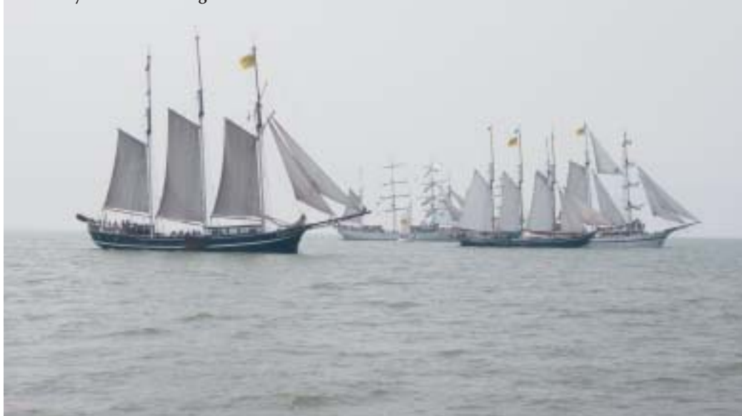
Wedstrijdzeilen met traditionele zeilschepen is en blijft een onvergetelijke ervaring.

Op 1 juni is het zover, dan gaat een imposante vloot van traditionele zeilschepen van start voor de vierde internationale weermannen- en –vrouwenregatta in successie. Vorig jaar werd voor het eerst gestart vanuit de Batavia Haven in Lelystad en ook dit jaar is dit onze uitvalsbasis. De deelnemende schepen zullen uitstekend bevoorrad aan de start verschijnen, want in tegenstelling tot de voorgaande Regatta's wordt dit keer het 'Captain's Dinner' tijdens de terugvaart naar Lelystad aan boord geserveerd!