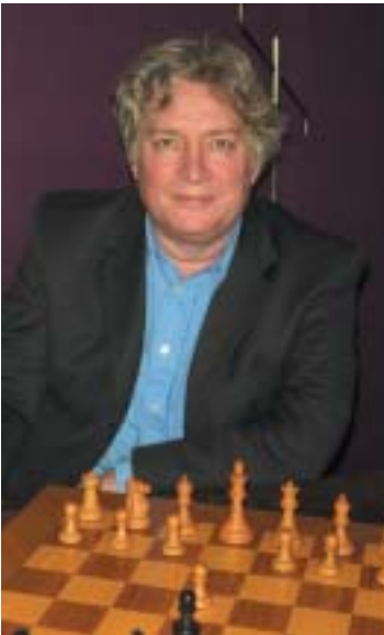
Jan Timman: “Het schaaktoernooi van 2005 krijgt het motto ‘Kinderen schaken voor kinderen’.”

Schaakgrootmeester Jan Timman, onlangs benoemd tot ambassadeur van Europa Kinderhulp, zal op 1 juni ook prominent aanwezig zijn bij de Internationale Weermannen- en -Vrouwenregatta.