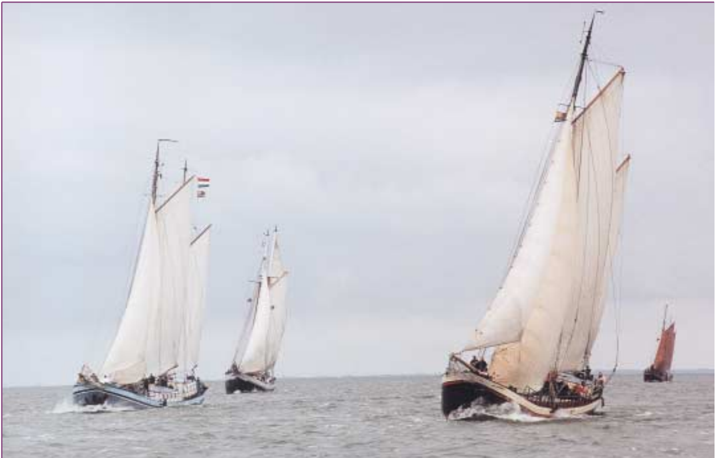
Zeilschepen in volle actie tijdens de wedstrijd van de vorige regatta in 2000.

sfeer. Ik hoop dus ook echt dat er uit de deelnemers aan de regatta mensen zullen opstaan die zo'n buitenlands kind een paar weken in huis willen nemen of een persoonlijke donatie in de vorm van geld of persoonlijke medewerking gaan geven. Ik sta helemaal achter de keuze voor Europa Kinderhulp omdat deze organisatie 100% op vrijwilligers draait. Dat is heel bijzonder en heel knap, want dit vergt van een aantal mensen een enorme opoffering aan tijd en energie. Het is ongelooflijk om te zien wat een betrekkelijk kleine club mensen van die organisatie voor elkaar krijgt. Ik sta hier 200% achter en hoop van harte dat de regatta in een meer dan alleen financiële spin-off voor Europa Kinderhulp zal resulteren."